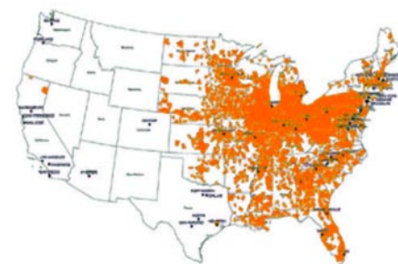
Skrócony czas doręczenia od 1 – 3 dni.

w systemie śledzenia przesyłek TNT oraz w postaci elektronicznej kopii dokumentu odbioru przesyłki