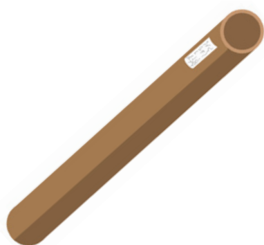
Figure 1: envois difficiles à expédier

Afin de pouvoir transporter des marchandises sur nos convoyeurs automatisés, elles doivent répondre à des standards prédéfinis. Si vos envois ne sont pas conformes aux standards communiqués, nous faisons en sorte que votre marchandise puisse tout de même entrer dans le réseau et être livrée intacte à la date définie.